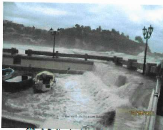
Slika 3. Prelivanje talasa u akvatoriji lučice

Očigledno je da je osnovni uzrok loše efikasnosti lučice Kacema prelivanje talasa preko zaštitnih objekata. Na Slici 3. je prikazano stanje vodene površine u lučici pri intenzivnom prelivanju talasa preko površine zapadnog pristana. Kako je akvatorija lučice veoma mala, poremećaji izazvani prelivanjem talasa se ne mogu amortizovati. Stanje talasanja u lučici je toliko nepovoljno da je neophodno izvaditi sve čamce iz vode (Slika 2), kako bi se sprečilo njihovo potapanje. Pošto su svi zidovi u akvatoriji lučice vertikalni veoma je izražena pojava rezonance, odnosno superponiranja ulaznih visina talasa, što dovodi do haotične slike talasanja u lučici.