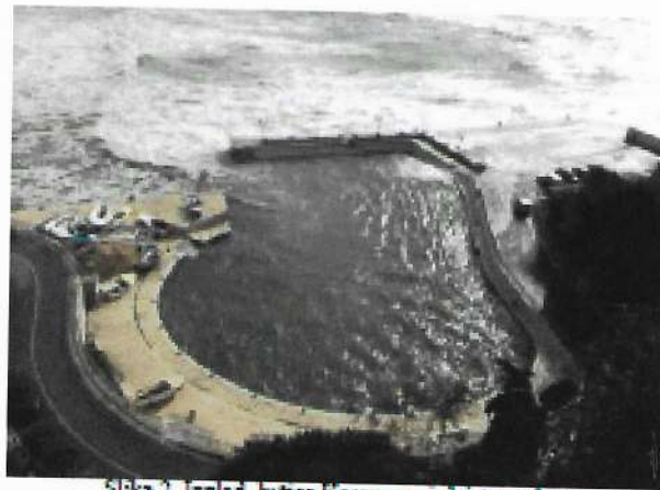
Slika 2. Izgled lučice Kacema pri dejstvu talasa

Očigledno je da je osnovni uzrok loše efikasnosti lučice Kacema prelivanje talasa preko zaštitnih objekata. Na Slici 3. je prikazano stanje vodene površine u lučici pri intenzivnom prelivanju talasa preko površine zapadnog pristana. Kako je akvatorija lučice veoma mala, poremećaji izazvani prelivanjem talasa se ne mogu amortizovati. Stanje talasanja u lučici je toliko nepovoljno da je neophodno izvaditi sve čamce iz vode (Slika 2), kako bi se sprečilo njihovo potapanje. Pošto su svi zidovi u akvatoriji lučice vertikalni veoma je izražena pojava rezonance, odnosno superponiranja ulaznih visina talasa, što dovodi do haotične slike talasanja u lučici.