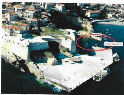
Slika 1. Nekadašnji izgled pristana u Ulcinju

Pokazalo se da je postojeća lučica "Kacema" u Ulcinju skoro potpuno nefunkcionalna pri dejstvu talasa većih visina iz južnog i jugozapadnog pravca. Naime, visine talasa u lučici daleko premašuju dozvoljene visine za takvu vrstu objekata, pa je veoma često dolazi do potapanja manjih plovila koji se nalaze unutar akvatorijuma lučice.